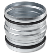
LWF N 100