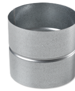
LWF M 180